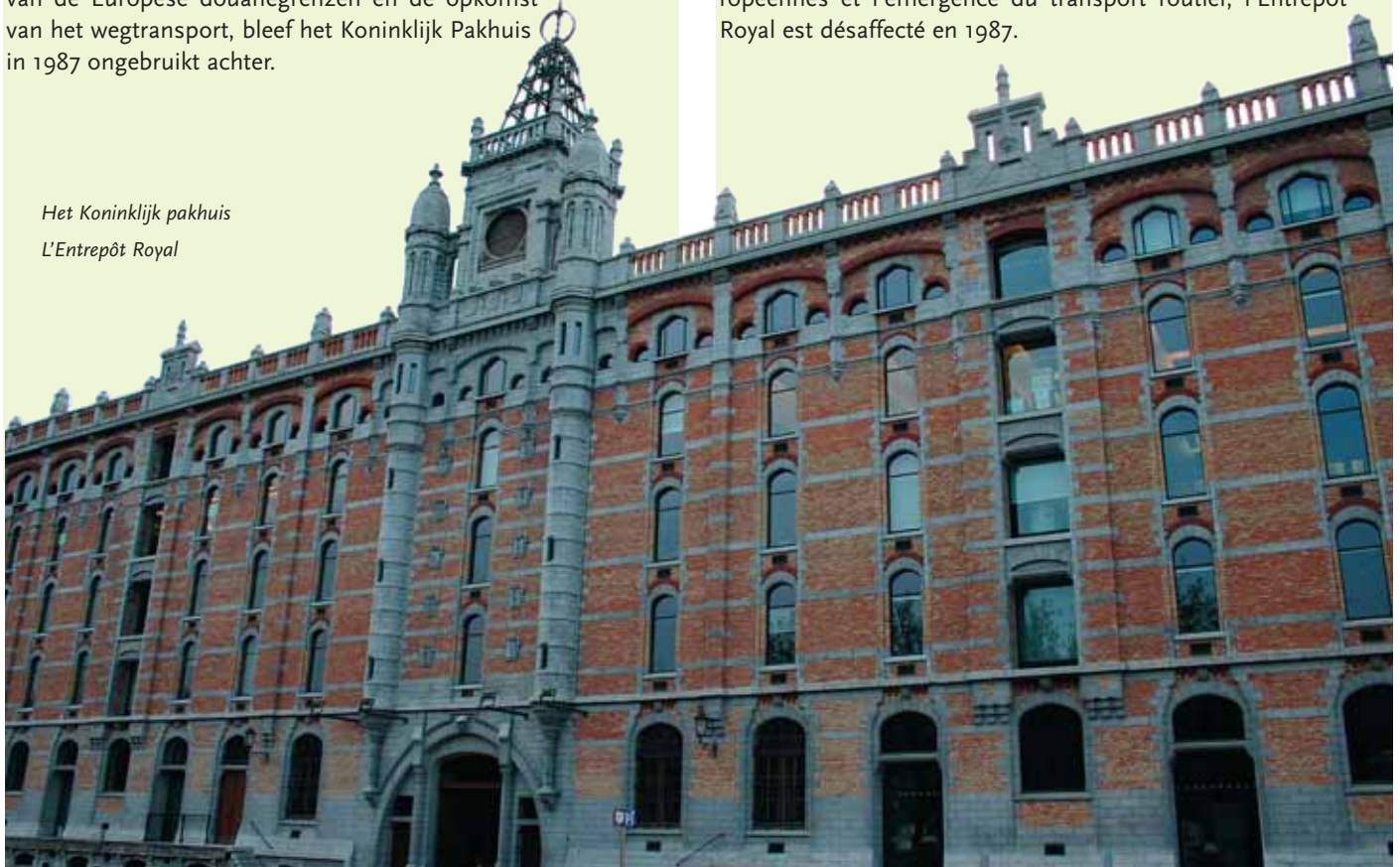
Het Koninklijk pakhuis L'Entrepôt Royal

Ontworpen als een heus "handelspaleis", bestemd voor de langdurige opslag van goederen onder toezicht van het stadsbestuur, werd het Koninklijk Pakhuis gebouwd tussen 1904 en 1906 op basis van de plannen van architect Van Humbeek. Het gebouw kenmerkt zich door indrukwekkende façades, bekleed met baksteen en blauwe hardsteen. De dikte van de muren en de kwaliteit van de kelders waren perfect afgestemd op een goede bewaring van de producten. Met de snel toenemende opheffing van de Europese douanegrenzen en de opkomst van het wegtransport, bleef het Koninklijk Pakhuis in 1987 ongebruikt achter.