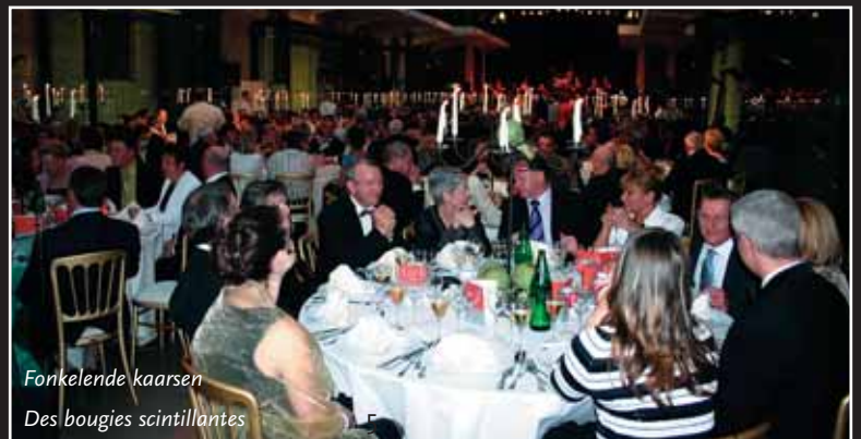
Fonkelende kaarsen Des bougies scintillantes