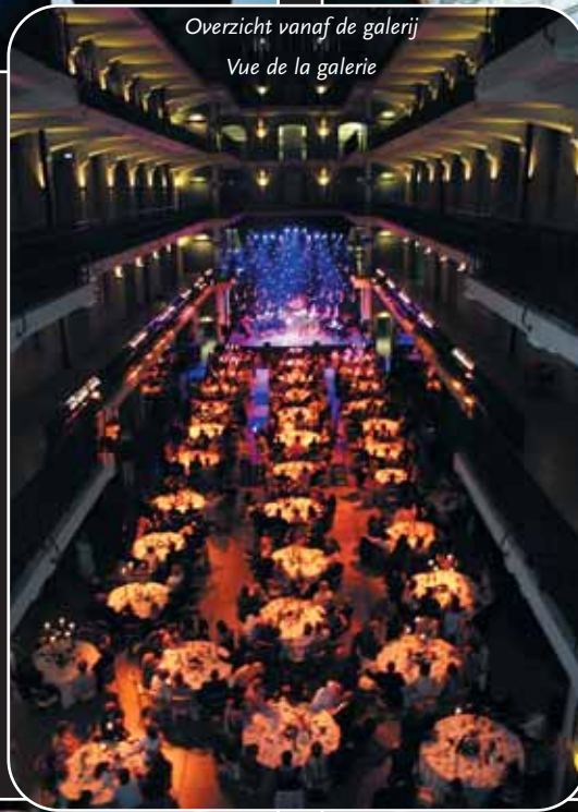
Overzicht vanaf de galerij Vue de la galerie