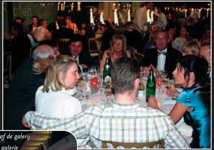
Gezelligheid aan de tafel van Van Dijk Foods Belgium NV Ambiance chaleureuse à la table de Van Dijk Foods Belgium NV