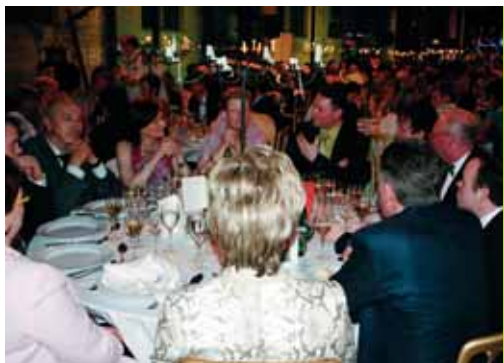
De tafel van Van Laethem bvba en Paul Cool bvba La table de Van Laethem bvba et Paul Cool bvba