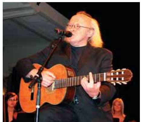
Freddy Biset zingt over de Champs Elysées Freddy Biset chante les Champs-Élysées