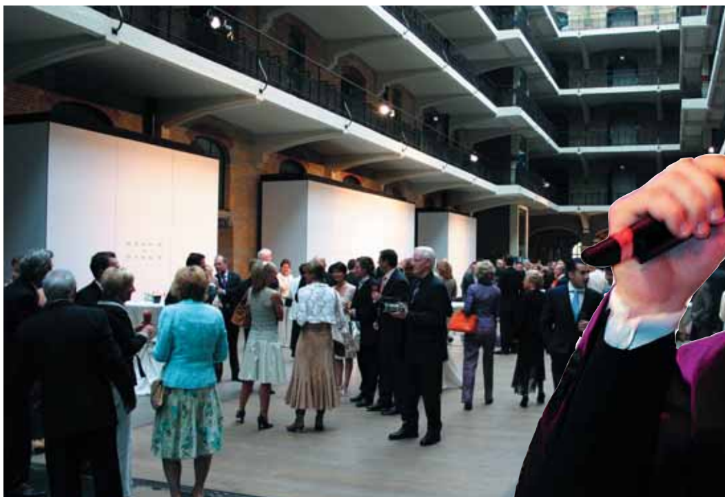
Eerst even bijpraten