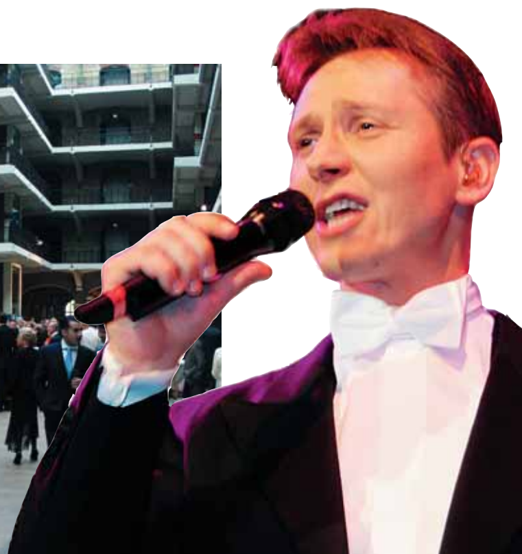
Helmut Lotti in actie!